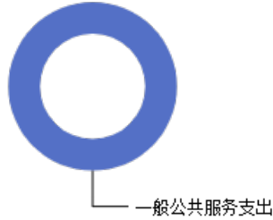
一般公共预算当年拨款结构图

2023年度一般公共预算当年拨款120.81万元，主要用于以下方面：一般公共预算服务支出120.81万元，占100.00%。